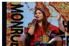
ESPECIAL: Doctrina Monroe de EE. UU. sigue impidiendo el progreso y la colaboración en Latinoamérica, según