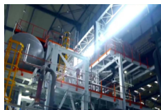
Economía china muestra impulso de recuperación consolidado en el primer trimestre