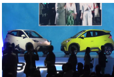
Lanzamiento de nuevo vehículo consolida a BYD como líder de movilidad eléctrica en mercado