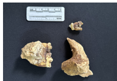
Descubierto yacimiento de fósiles de panda en cueva más larga de Asia en suroeste de China