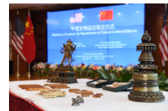
EE. UU. devuelve a China 38 piezas de reliquias culturales, señal de mejora del intercambio cultural entre ambos países