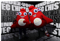
Ceremonia para celebrar la cuenta regresiva de 100 días para los JJOO de París 2024