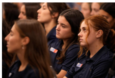
ESPECIAL: Deportistas uruguayos vuelven a entrenar a China