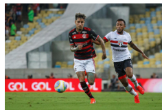
Campeonato Brasileño Serie A: Flamengo VS Sao Paulo