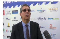
Perú busca recuperar el desarrollo de actividad turística con feria nacional e internacional