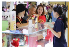
La IV CICPE concluye en Hainan